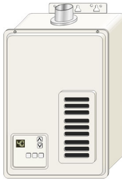
<ガス湯沸器（強制排気式）>